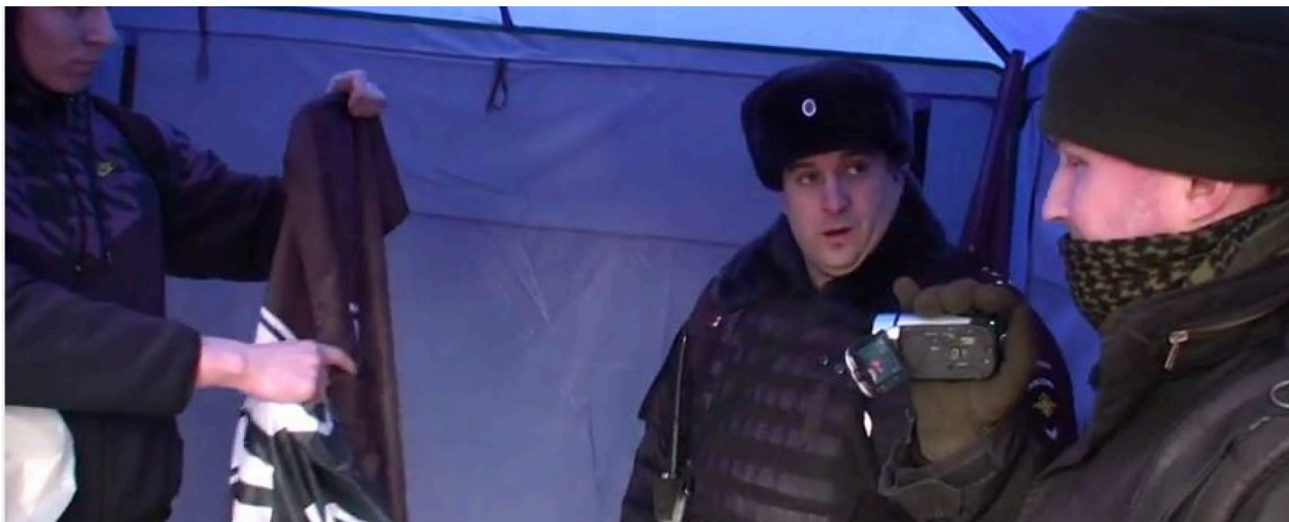
Фото: полиция проверяет флаги "Народной воли" на входе на шествие