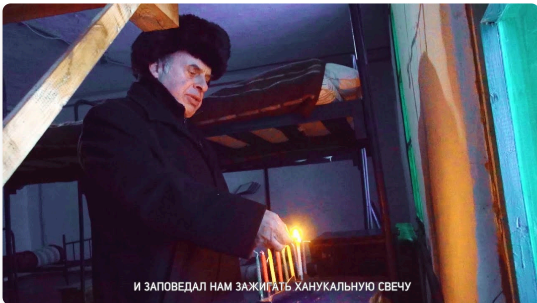
И ЗАПОВЕДАЛ НАМ ЗАЖИГАТЬ ХАНУКАЛЬНУЮ СВЕЧУ

У слова «отказники» есть несколько значений. Первое, которое приходит на ум, — это дети, от которых отказались родители. Второе значение известно не столь широко. В СССР «отказниками» называли тех, кому власти не разрешали покинуть страну. В 1960–1980-е годы желание эмигрировать уже не считалось преступлением, однако расценивалось властями как предательство. Фильм «От рабства к свободе» рассказывает историю движения еврейских отказников в СССР. Главный герой картины — Натан (Анатолий) Щаранский, советский правозащитник и диссидент, один из активных участников движения отказников. В 1977 году его арестовали по обвинению в шпионаже в пользу США, измене Родине и антисоветской агитации. По этим статьям, по словам Щаранского, его могли приговорить к смертной казни. В 1978 году ему дали 13 лет заключения.