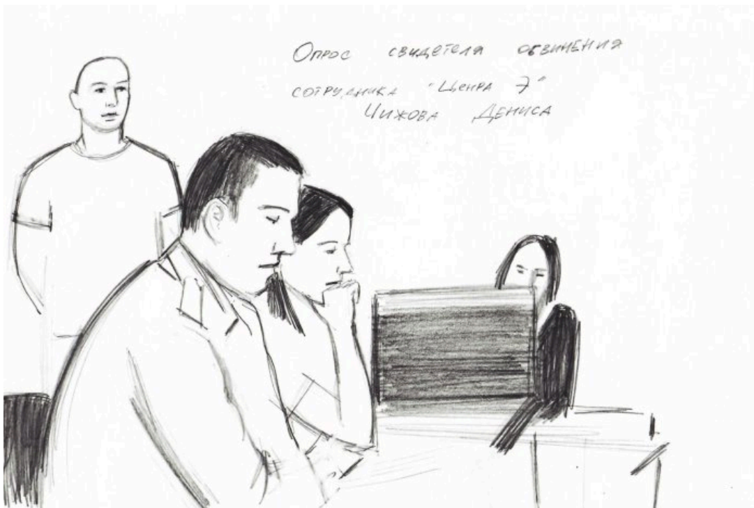
Зарисовка с суда / Иллюстрация: Радик Вильданов

Адвокат: Подготовка — юридическое понятие. Можете сказать, в чем конкретно заключалась подготовка к свержению конституционного строя? Что они делали в рамках подготовки?