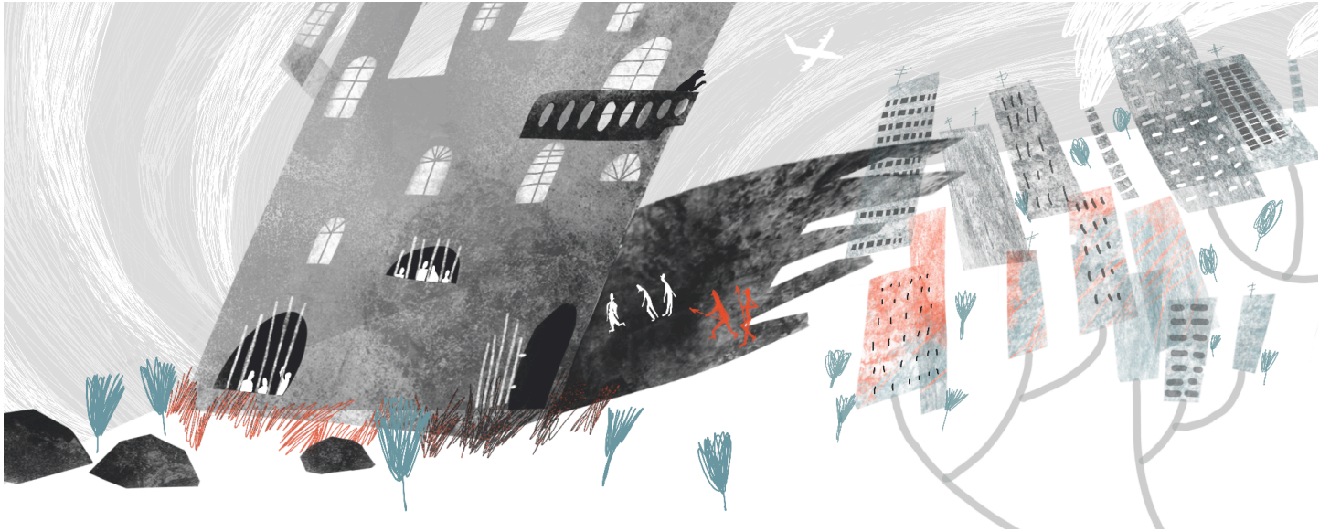
Иллюстрация: Катерина Гузней для ОВД-Инфо