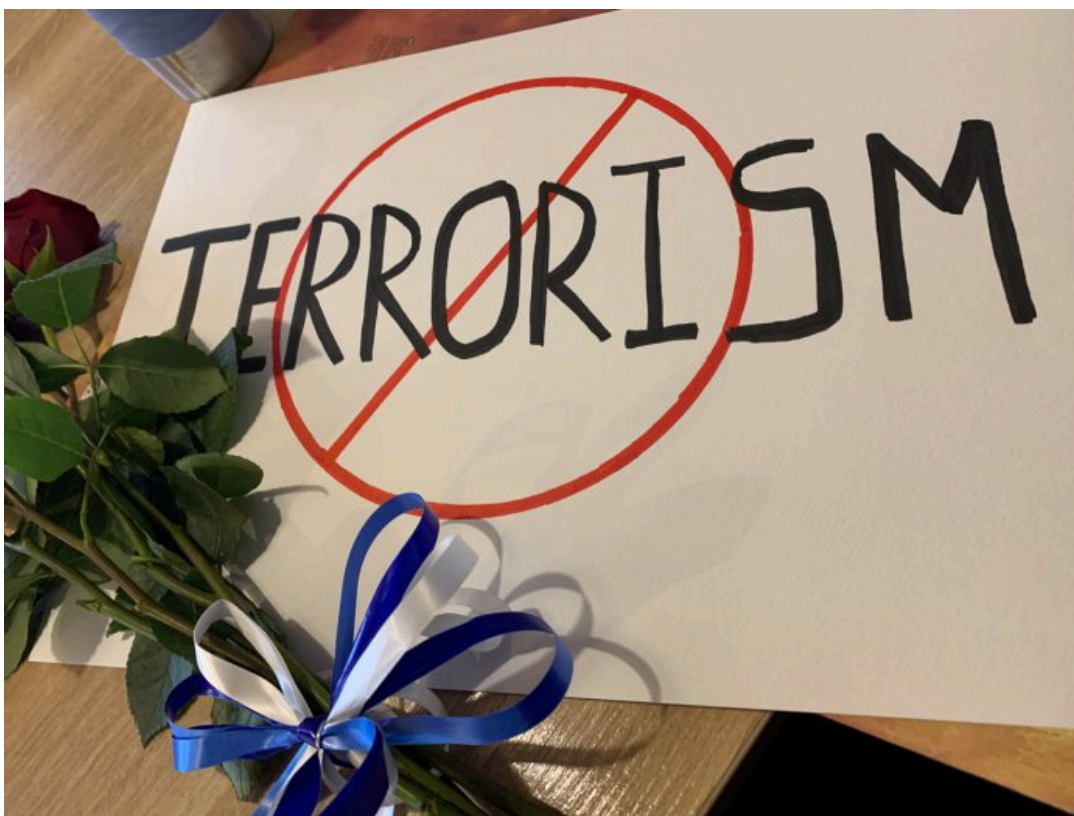
Плакаты, с которыми задержали Ирину

На данный момент по делу от меня требуется явка в отдел для «исправления неточностей в протоколе». Я со своей стороны не вижу в этом необходимости. Адвокат также не видит необходимости в моей явке. Но она готова сопровождать меня и консультировать, если потребуется, сейчас мы на связи.