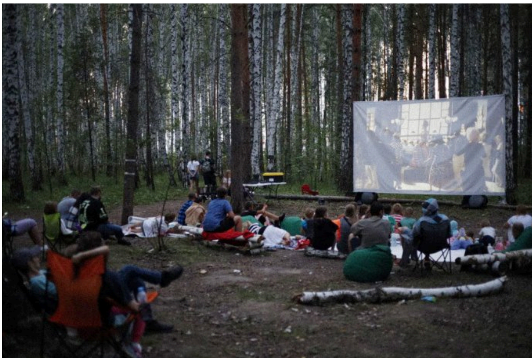
Кинопоказ в Березовой роще, организованный местными жителями, июль 2023 года