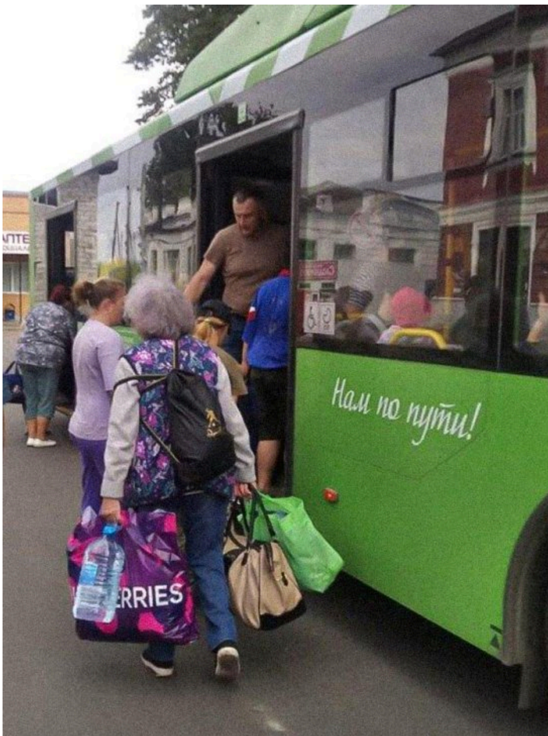
Эвакуация жителей Хомутовского района Курской области, август 2024 года

До 24 февраля 2022 года здесь было безопасно. Более того, на нашей территории было безопасно даже до 2023 года, когда массово не были распространены беспилотные летательные аппараты, начиненные боеприпасами. Сейчас противник активно применяет их для поражения живой силы и техники. Наш район — не исключение, по нам часто прилетает. У нас тут нет даже больницы — так мы потеряли одну человеческую жизнь: за 70 километров