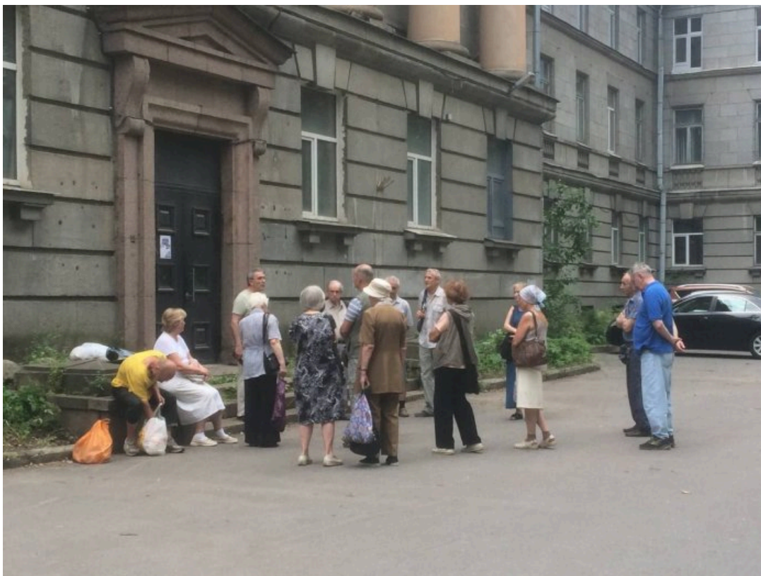
Активисты на фоне здания ВНИИБ, лето 2025

В 2020 году суд приостановил действие разрешения на стройку, однако спустя два года застройщик смог его продлить — начались подготовительные работы, которым активно препятствовали местные жители. В 2022 году инициативная группа проводила народный сход в защиту здания, а в 2023 предлагала подать обращения для прямой линии с Владимиром Путиным.