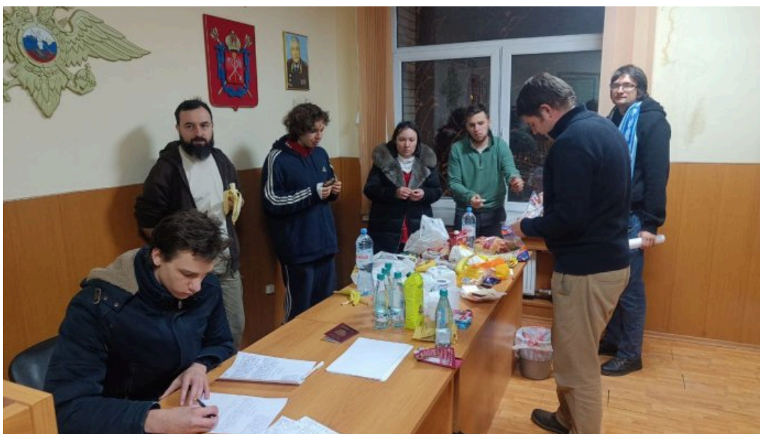
Задержанные в отделе полиции