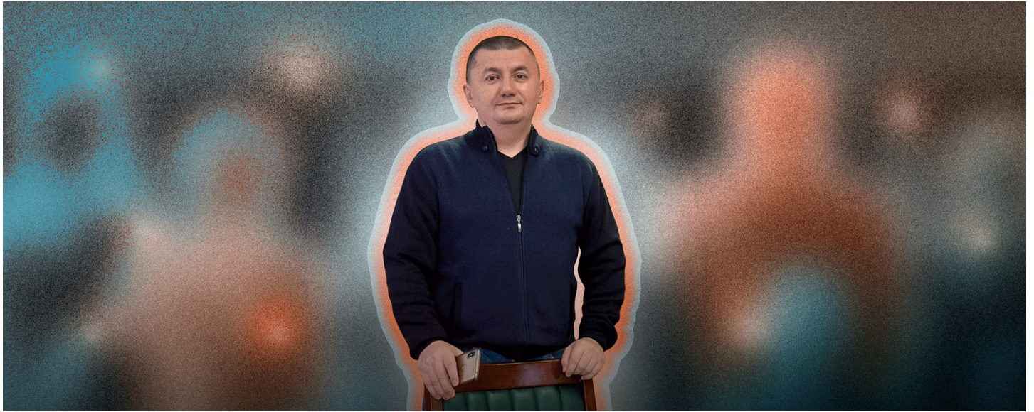
Фото: SOTAvision / Коллаж: ОВД-Инфо